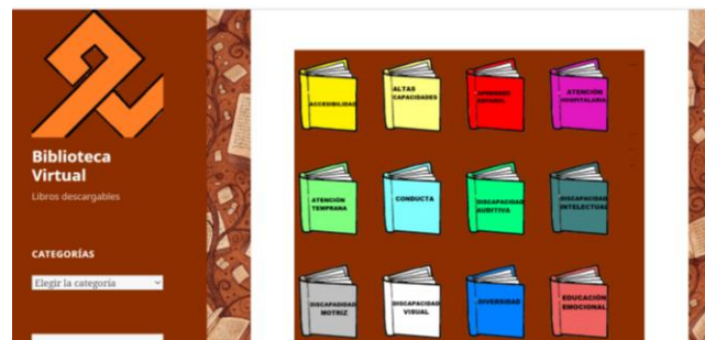
1. irudia. NHBBZ/CREENaren onlineko liburutegia

https://creena.educacion.navarra.es/web/bvirtual/