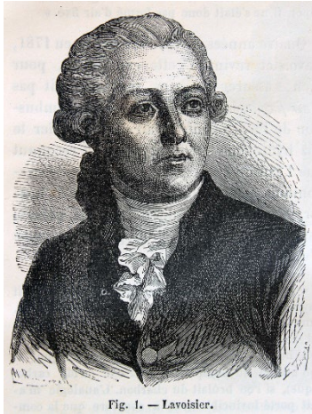
Fig. 1. — Lavoisier.

En uno de los primeros trabajos relacionados con la ciencia de los alimentos, en 1780, el farmacéutico suizo Carl Wilhelm Scheele aisló y caracterizó la propiedades químicas de la lactosa. Además, este mismo investigador en 1782 describió un método para conservar el vinagre, aisló el ácido cítrico del limón y de las grosellas (1784 y 1785, respectivamente) y el ácido málico de las manzanas (1785). Estos estudios le llevaron a poder determinar, en 1785, el contenido en ácido acético, málico y tartárico en numerosas frutas (1785).