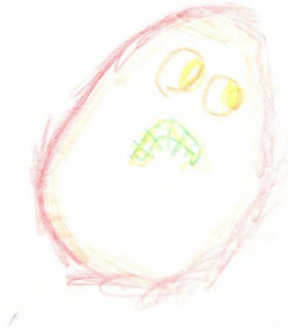
2. Irudia.