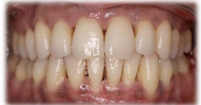
Egileak: Aguirre LA, Estefanía R, Fernández A, García AM,

Beraz, periodontoa osasuntsu mantentzeko, biofilma edo bakterio- plaka kontrolpean izatea beharrezkoa izango da.