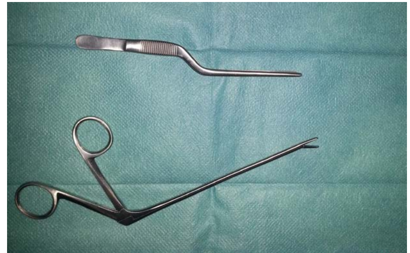
Ahate-moko erako matxardak