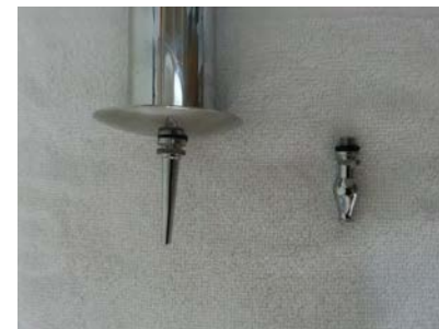
Olibak (estua eta zabala)