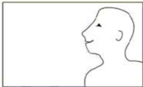
esquema gráfico ley de la mirada