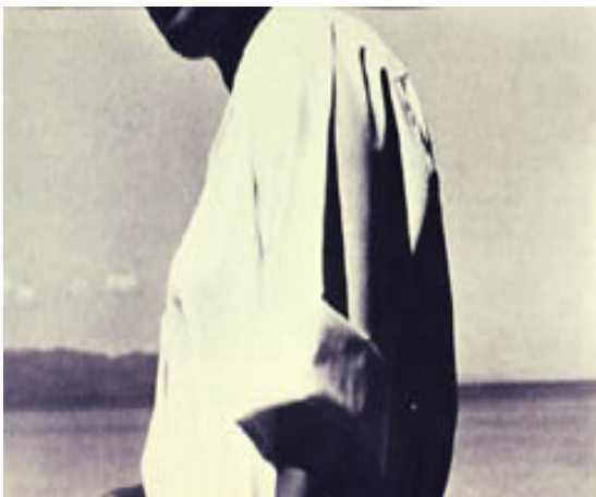
Ralph Gibson s/t. 1975

■ Hasiera batean, enkuadre ezak, irudia berrenkuadratzeko saiakera eragiten du ikuslearengan, ohiko ikuskerara eramateko saiakera egingo du. Bere desioen ezintasunaz ohartu eta onartzen duenean, proposamen berritzaileak eskaini ahal dion gozamen estetikoari bidea zabalduko dio.