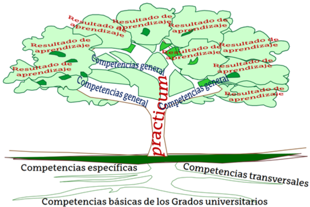
Figura 2. Representación de la formación en enfermería

Según recoge la literatura al respecto, el practicum es el contexto adecuado para desarrollar las competencias (9,20). Por lo tanto, para formar al alumnado de enfermería de manera que pueda trabajar como enfermera o enfermero en diferentes áreas socio-sanitarias, se deberán ofertar contextos adecuados para desarrollar dichas competencias en el practicum, (servicios y unidades hospitalarias, centros de Atención Primaria y centros socio-sanitarios, entre otros).