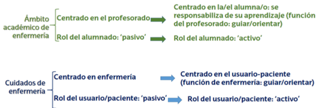
Figura 2. Cambio de paradigma en el ámbito académico y en el asistencial

En 2010, arrancó la puesta en marcha del Grado en el marco de adaptación al Espacio Europeo de Educación Superior (EEES). Previamente, el sistema universitario se adaptó al marco del EEES (Plan Bolonia) (3,6), un espacio que se creó para unificar el marco educativo de los criterios económicos y de movilidad que motivaron la agrupación de la Unión Europea (3,7). Entre sus objetivos destacan el respeto a la diversidad educativa y cultural de Europa, el fomento de la competitividad del sistema universitario europeo en el ámbito internacional, la adopción de un sistema comparable de titulaciones universitarias en Europa, facilitando la movilidad de los profesionales y estudiantes y, la promoción de la calidad y excelencia como valores de la educación superior europea (7).