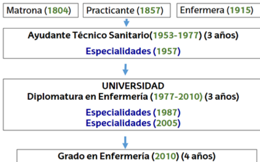
Figura 1. Titulaciones para la formación en enfermería

La formación académica en enfermería en nuestro entorno ha sido impulsada a partir del siglo XX (Figura 1) y ha ido adaptándose a las necesidades de cuidados, a los cambios sociopolíticos y educativos acontecidos (1).