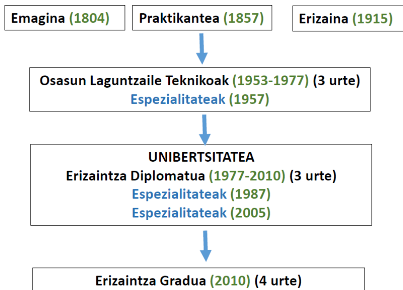
1. Irudia. Erizaintzako prestakuntzarako tituluak.

Erizaintzako prestakuntza akademikoa gure inguruan XX. mendetik aurrera hasi zen bultzatzen (1. Irudia), eta zainketen beharretara eta gizarte, politika eta hezkuntza aldaketetara egokitzen joan da pixkanaka(1).