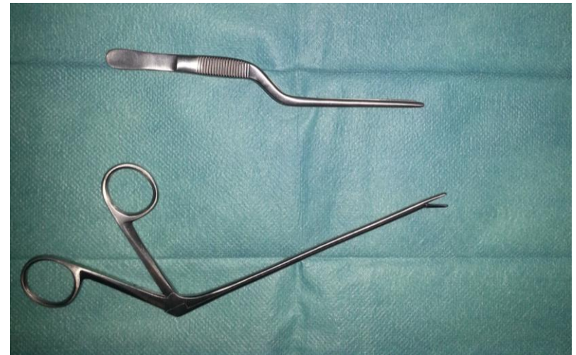
Pinzas tipo pico pato