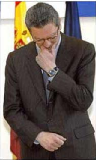
Alberto Ruiz-Gallardón, ayer, en el Ayuntamiento.