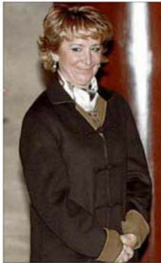
Esperanza Aguirre, ayer, en una entrega de premios.