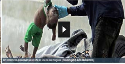
Un hombre tira al costado de un niño en una de las morgues. | Reuters /VEA MÁS (MAGNET)