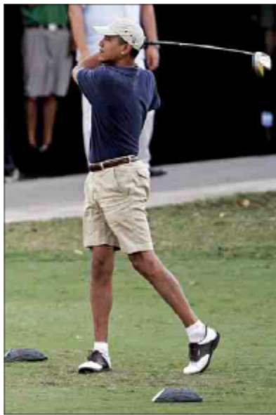
El presidente de EE.UU. Barack Obama, juega a golf, que se celebró en Solheim, Nueva York, el 17 de febrero de 2008.

El ataque a los miembros de la inteligencia de la CIA, el peor sufrido por la Agencia desde 1983, se produjo en el primer mes del año, cuando se incrementó el paro de la Seguridad Social, lo que elevó a 1.845.923 el número de desempleados en el primer mes del año.