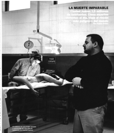
LA MUERTE IMPARABLE Ciudad Juárez, 3,5 millones de habitantes. Cinco puercas violentas al día. Viste al rincón más peligroso del mundo Por Juan Carlos