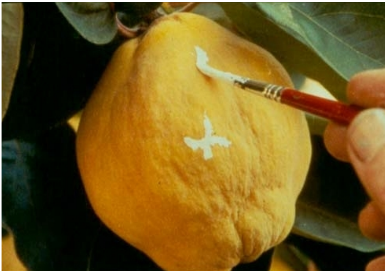
El sol del membrillo (V́ctor Erice, 1992)

Objektu edo pertsone baten zati bat erakusten duen plano da.