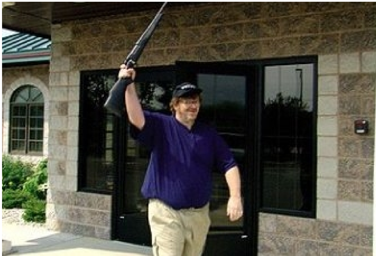
Bowling for Columbine (Michael Moore, 2002)

Pertsona baten gorputza belaunetara arte erakusten duen plano da.