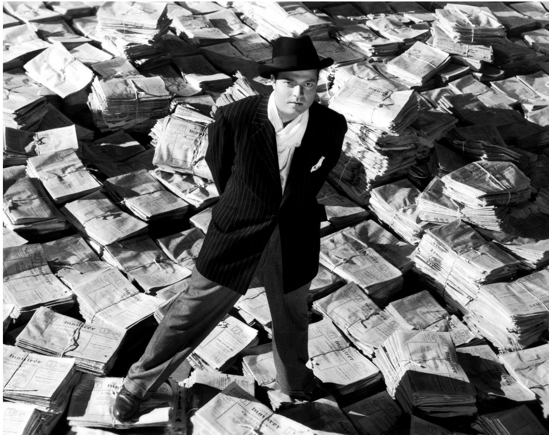
Ciudadano Kane (Citizen kane, Orson Welles, 1941)

Objektu edo pertsonaren goiko angelutik hartutako plano da.