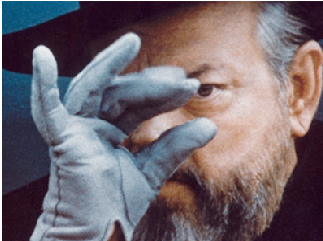
F for Fake (Orson Welles, 1974)

Pertsona baten burua erakusten du, goiko eta beheko parteak moztuta.