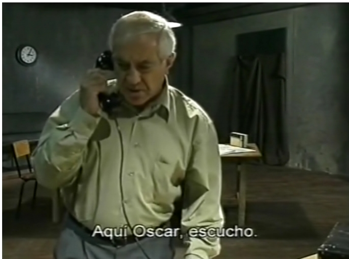
La noche del golpe de estado (La nuit du coup d'État (Lisbonne, avril 1974), Ginette Lavigne, 2001).

Pertsonaren gorputza gerriko beheko partera arte erakusten duen plano da.