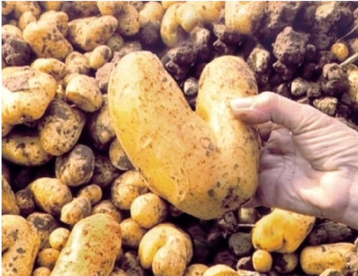
Los espigadores y la espigadora (Les glaneurs et la glaneuse, Agnès Varda, 2000)

Pertsonai baten subjektibitatea erakusten duen plano da.