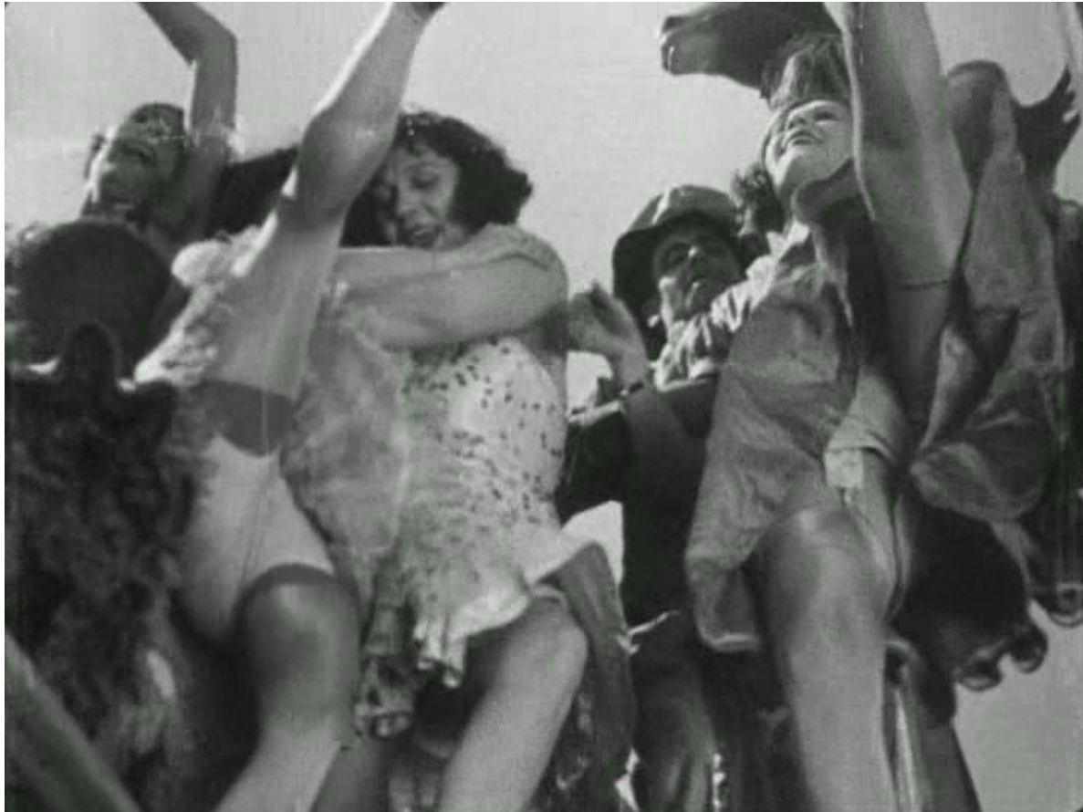
A propósito de Niza (A propos de Nice, Jean Vigo, 1930)

Objektu edo pertsonaren beheko angelutik hartutako plano da.