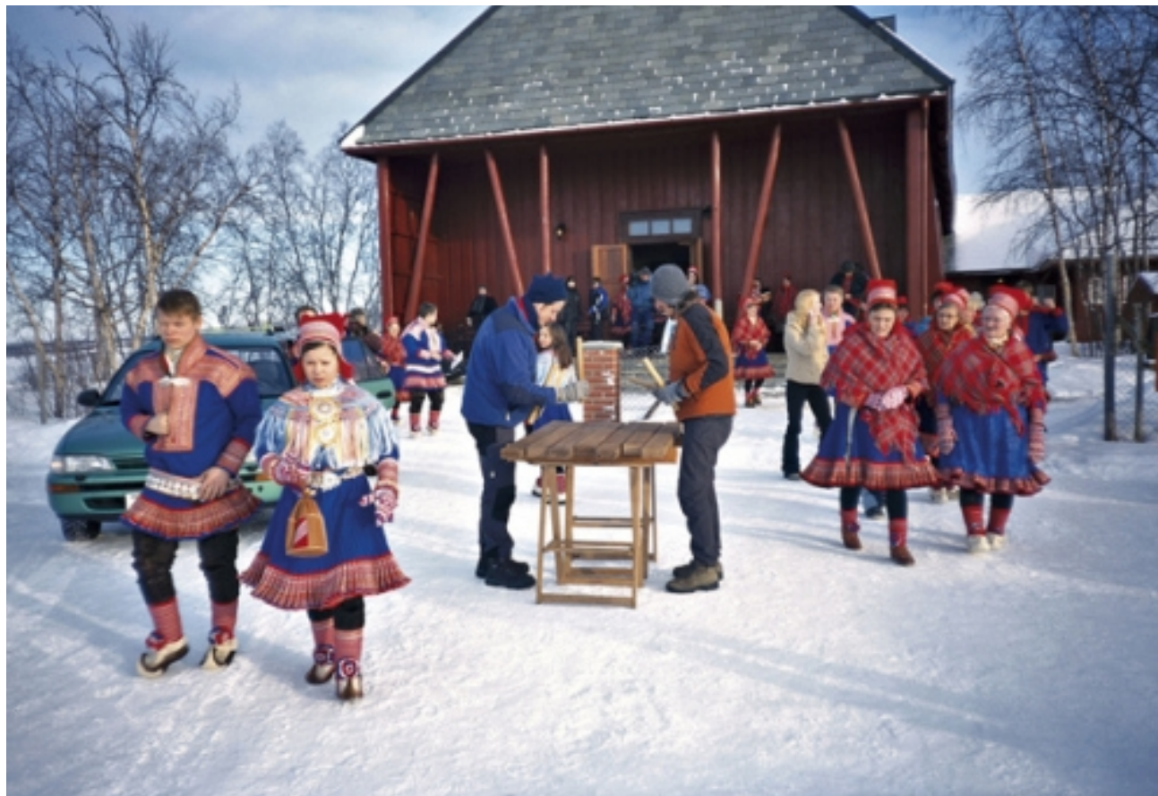
Nömadak tx (Raúl de la Fuente, 2006)

Pertsonen gorputz osoa eta haien ingurua edo kokalekua erakusten dituen planoak da.