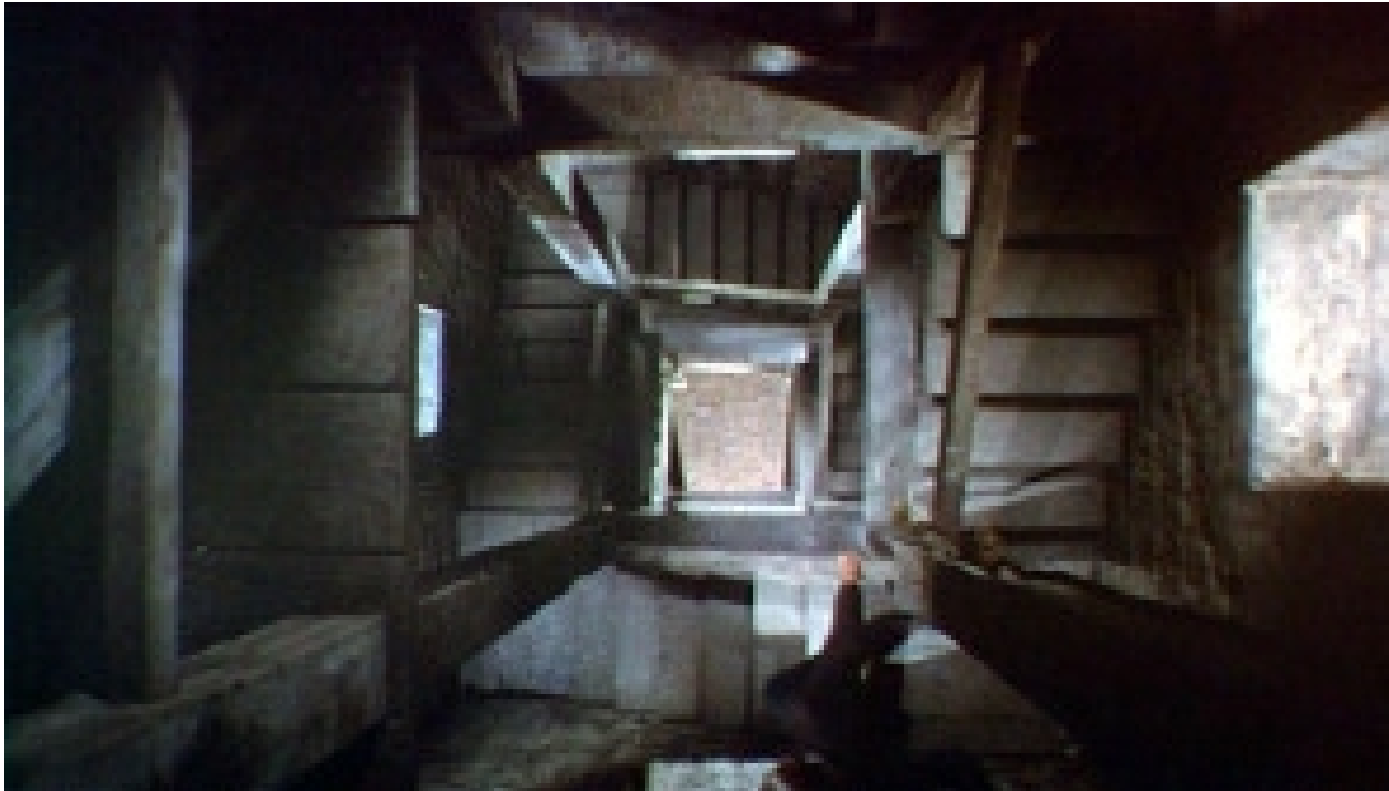
Vértigo. (De entre los muertos). Alfred Hitchcock, 1959.

Se realiza desde un ángulo completamente superior, con la cámara dirigida hacia abajo.