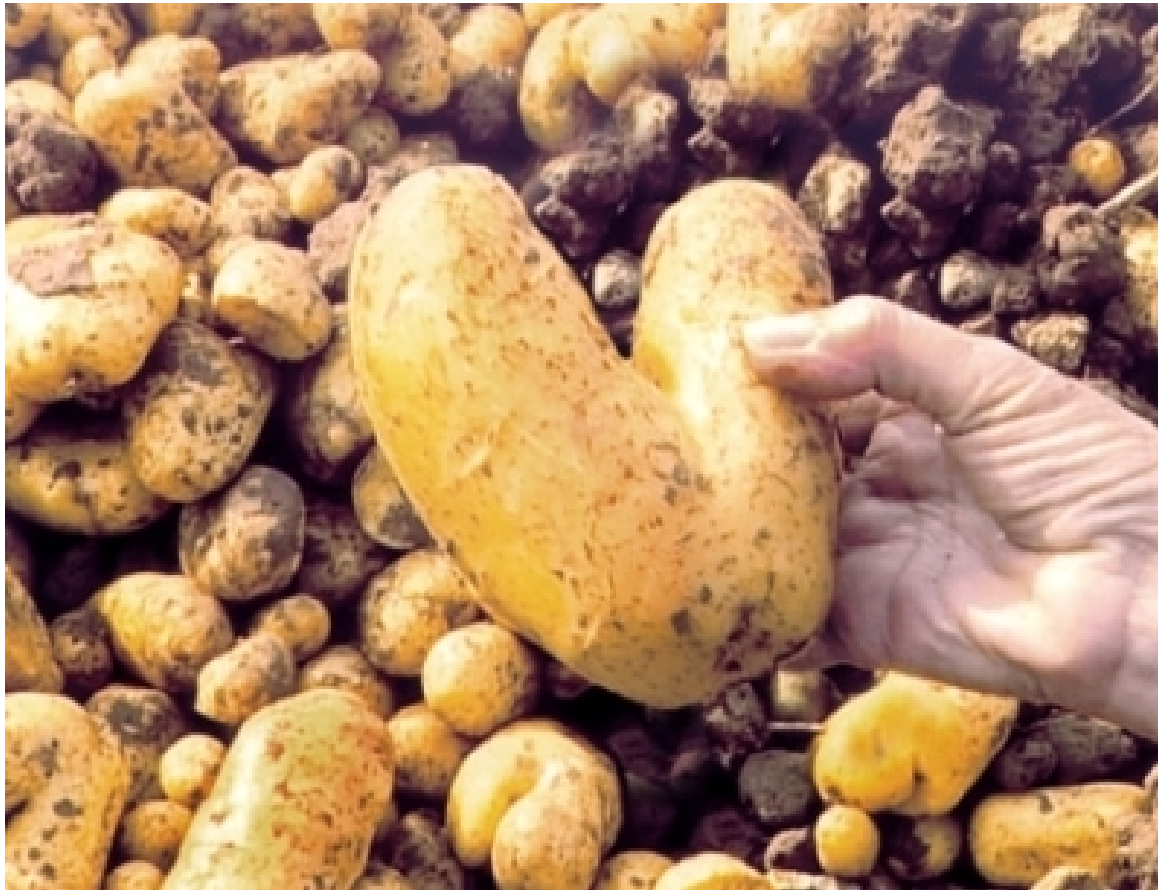
Los espigadores y la espigadora (Les glaneurs et la glaneuse, Agnès Varda, 2000)

Muestra la mirada subjetiva de la persona que realiza la fotografía. Normalmente muestra una parte de su cuerpo.