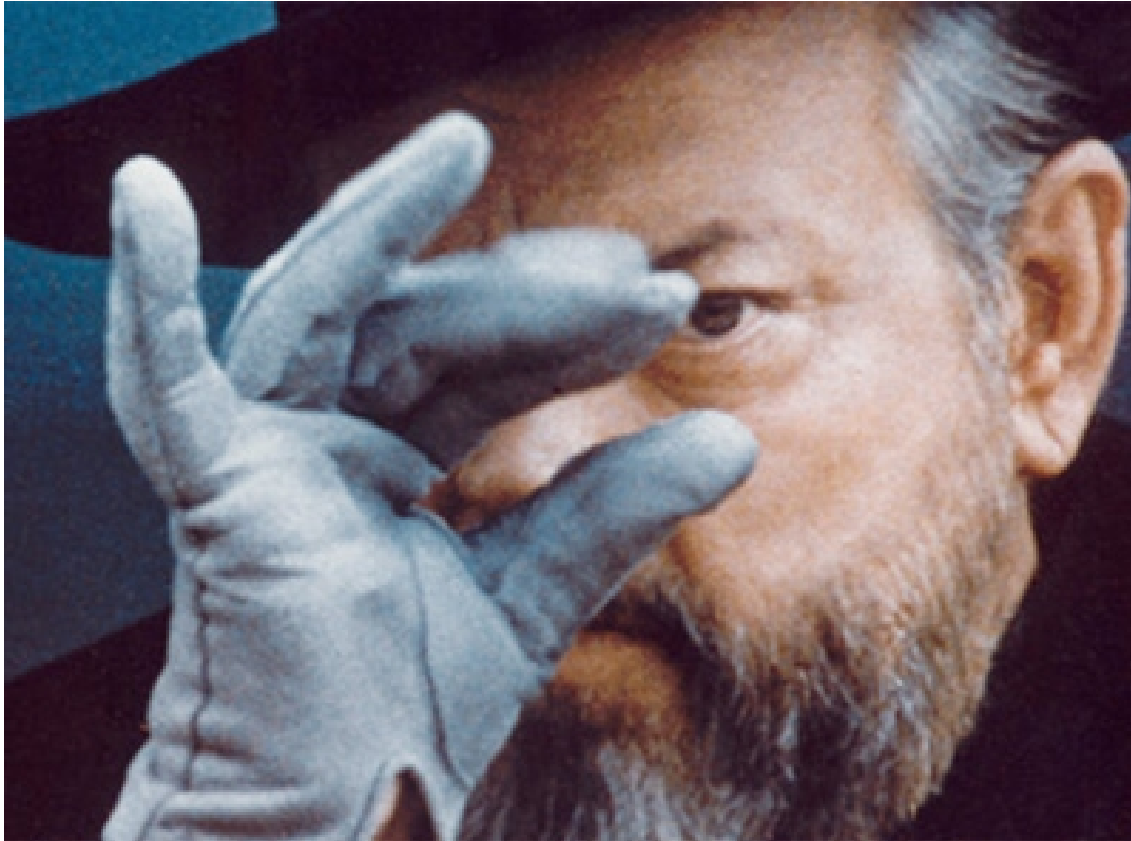
F for Fake (Orson Welles, 1974)

Muestra el rostro de una persona, algo cortado en las partes superior e inferior. Permite transmitir los sentimientos de la persona retratada.