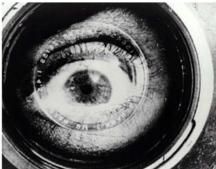
El hombre de la cámara (Человек с киноаппаратом), Dziga Vertov, 1929.