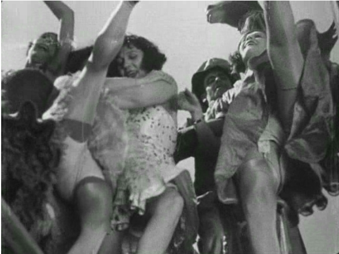
A propósito de Niza (A propos de Nice, Jean Vigo, 1930)

Se realiza desde un ángulo inferior a la persona retratada. Transmite un sentimiento de inferioridad a quien lo observa.