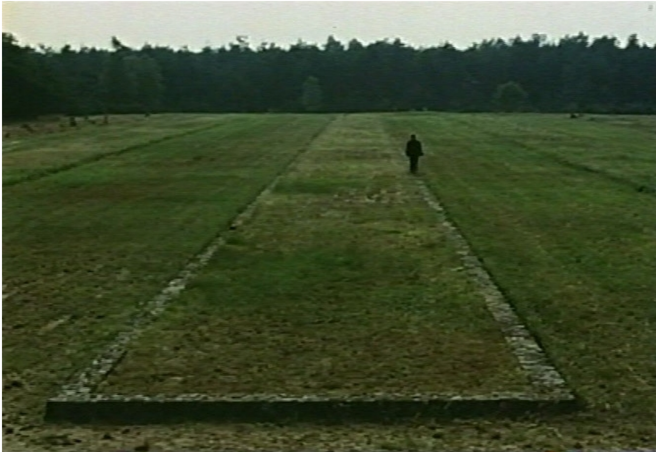
Shoah (Claude Lanzmann, 1985)

Se trata de un plano muy abierto donde lo importante es el paisaje.