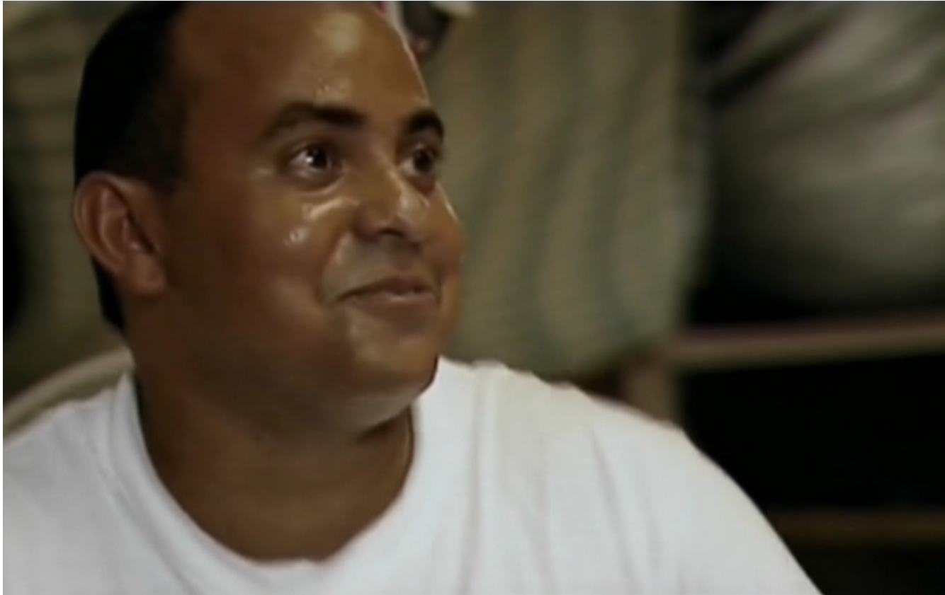
Balseros (Carles Bosch y Josep María Domènech, 2002)

Muestra el rostro de una persona hasta los hombros. En cine se utiliza mucho en las conversaciones de plano-contraplano.