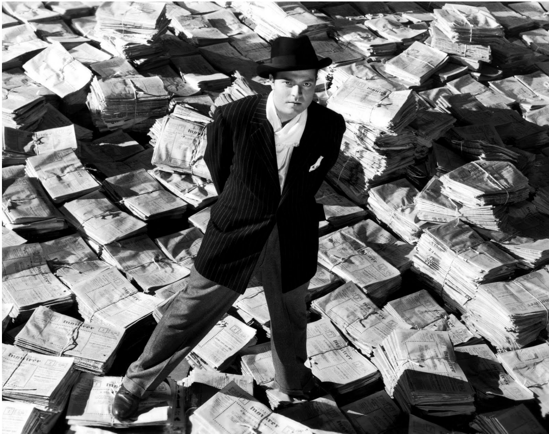
Ciudadano Kane (Citizen Kane, Orson Welles, 1941)

Se realiza desde un ángulo superior a la persona retratada. Transmite un sentimiento de superioridad a quien lo observa.