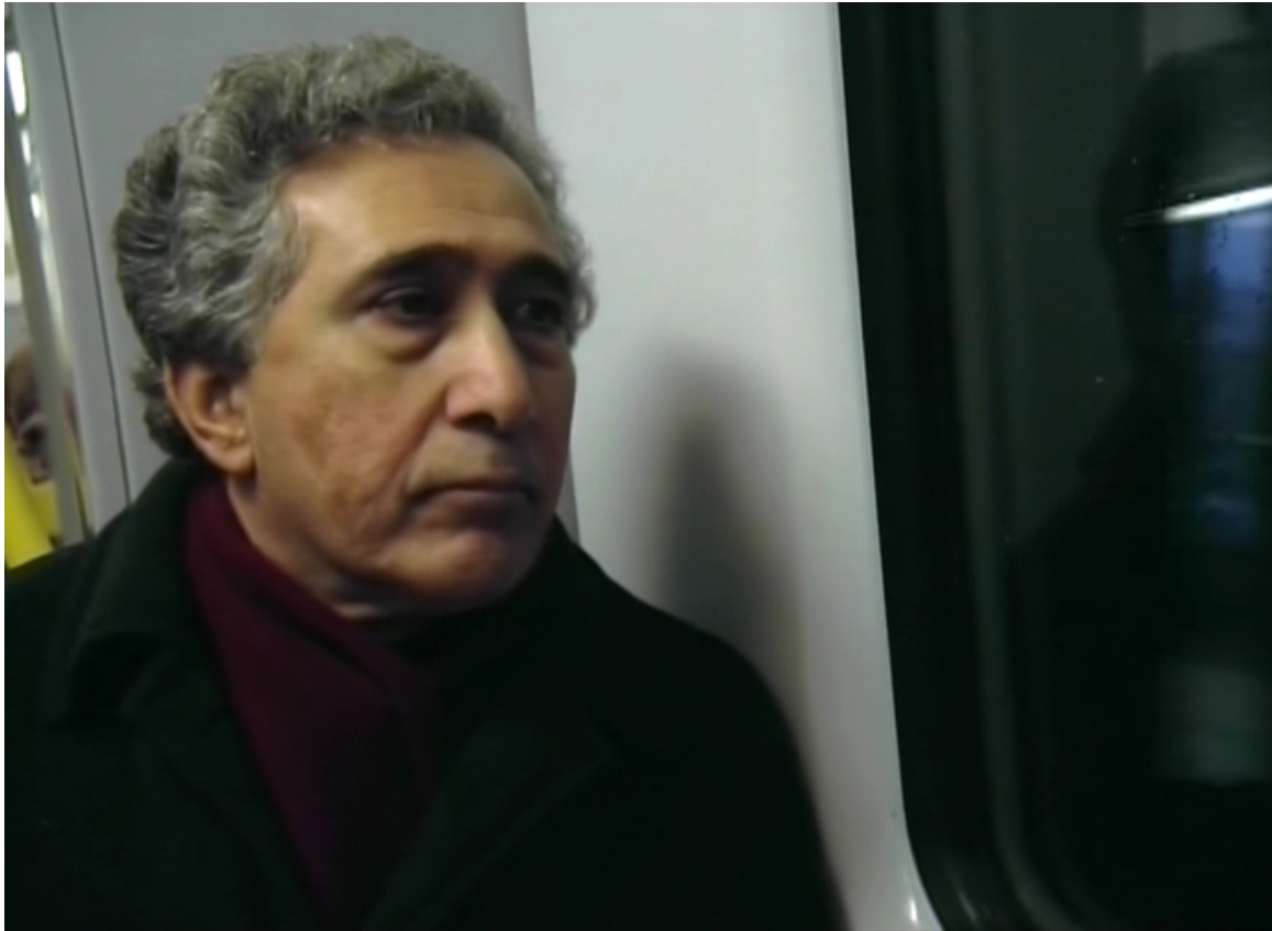
La espalda del mundo (Javier Corcuera, 2000)

Muestra la parte superior de una persona prácticamente hasta la cintura.