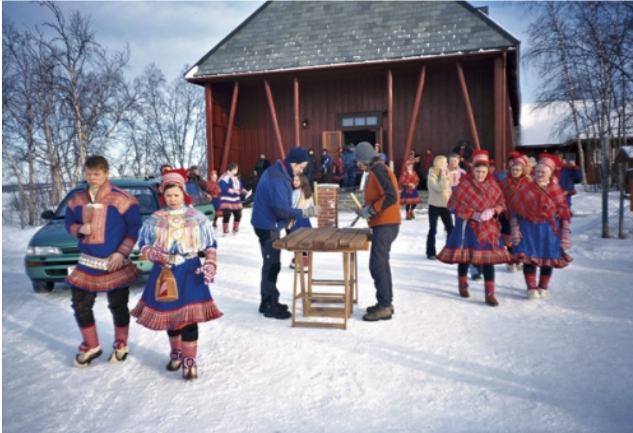
Nömadak tx (Raúl de la Fuente, 2006)

Muestra el cuerpo completo de las personas, así como el entorno en el que se sitúan.