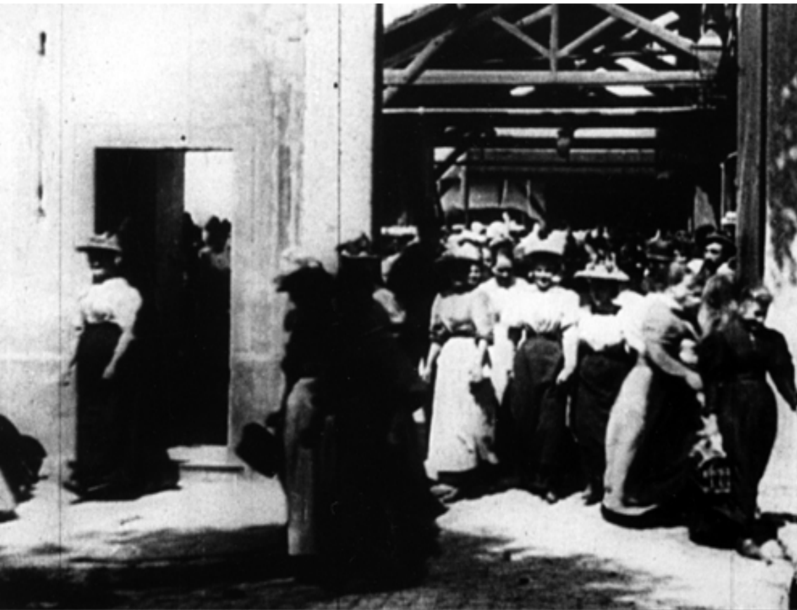
Salida de los obreros de la fábrica ( La Sortie des Usines , Francia, 1895). Louis Lumière (dir.).