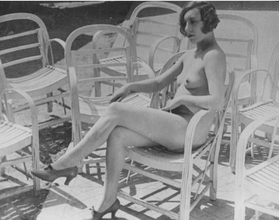
A propósito de Niza (A propos de Nice, Francia, 1930) Jean Vigo (dir.).