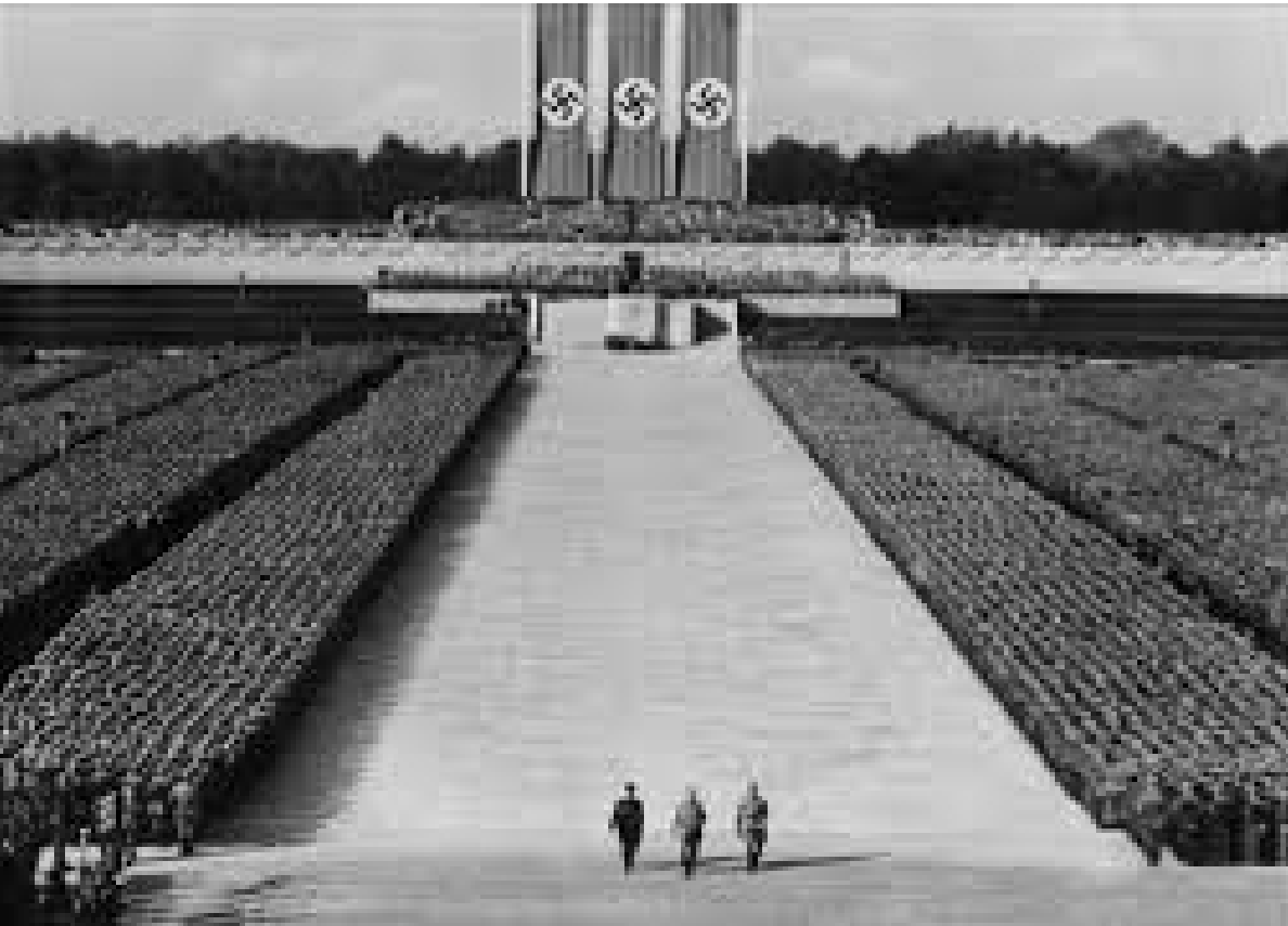
El triunfo de la voluntad ( Triumph des Willens , Alemania, 1935). Leni Riefenstahl (dir.).