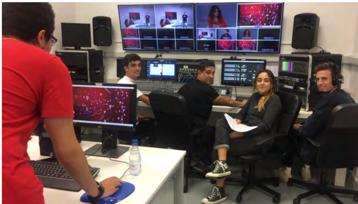
Imagen propia. Marian G. Abrisketa