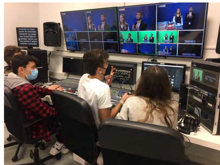
Plató y sala de control de la facultad de Ciencias Sociales y de la Comunicación de la UPV-EHU.