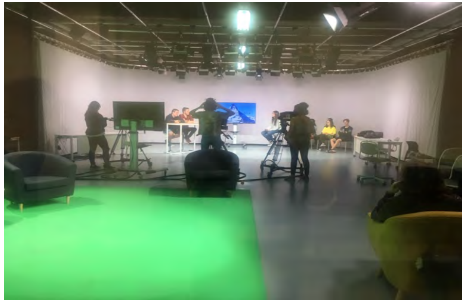
Imagen del plató de TV de la facultad de Ciencias Sociales y de la Comunicación UPV-EHU.