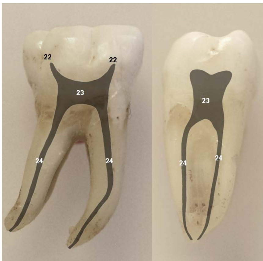
Lehenengo behe hagin iraunkorra. 22. Muin-adarrak. 23. Koroa-barrunbea. 24. Muin-kanalak.

Koroaren iduneko herena zeharka ebakiz gero, muin-barrua laukia dela ikus daiteke, apur bat handiagoa hurbil-urrun ardatzean mihi-masaila ardatzean baino, eta koroaren silueta bera bezala apur bat zabalagoa alde hurbilean alde urrunean baino. Hala ere batzuetan boli pus karen bat aurkitzen da koroa-barrunbeto mihi-aldean edo masail-aldean. Erroa zeharka ebakiz gero, muin-kanalei erroen siluetaren antza hartzen zaie. Erro hurbilak giltzurrun itxura edo 8 itxura izaten du. Erro urruna biribilagoa izaten da eta muin-kanal bakarduna, baina erro zabalagoetan muin-kanal bi aurki daitezke bolizko hesi txikiak tarteka dituela.